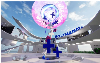
Holtmann+ Metaversum