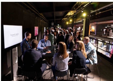
Designing the Future Summit in Berlin