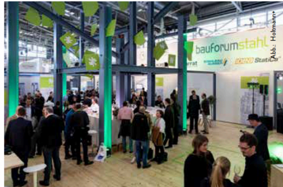
Bauforumstahl e.V. mit ihrem Messeauftritt auf der „Bau 2023“ in München.

Der Aufbau von Communitys sowie das Etablieren und Stärken von Netzwerken rückt vermehrt in den Fokus. Die Besucher wollen Plattformen, um innerhalb der sich schnell transformierenden Welt über diese Themen ins Gespräch zu kommen. Es geht dabei um Networking, den intensiven Austausch innerhalb der Branchen und die Diskussion über potenzielle Herausforderungen und den dazu passenden Lösungsansätzen.