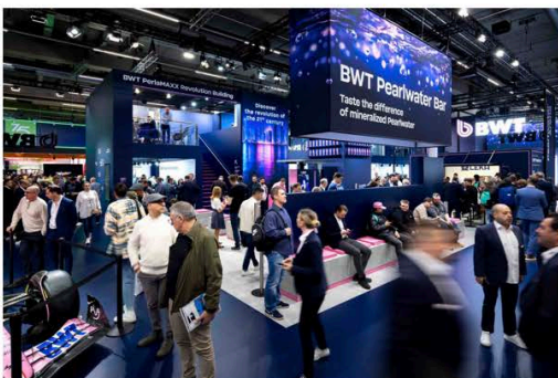
BWT auf der ISH 2025