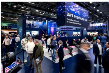
BWT Pearlwater City