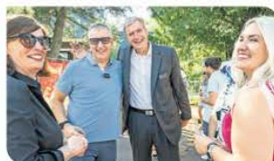
Feierliches Wiedersehen mit der Muttergesellschaft NürnbergMesse.

Parallel zu den Kundenaufträgen im Hochbau-Sektor errichtete und ver-