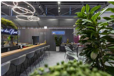
Messestand auf der Expo Real

Mit einem innovativen und nachhaltigen Standkonzept setzte die Holtmann+ GmbH & Co. KG den gemeinsamen Messeauftritt von Union Investment und DZ HYP auf der Expo Real 2025 in München erneut erfolgreich um. Das Ziel: die Eigenständigkeit beider Unternehmen zu bewahren und zugleich ihre enge Zusammenarbeit sichtbar und erlebbar zu machen.