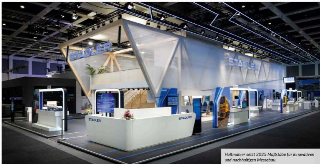
Holtmann+ setzt 2025 Maßstäbe für innovativen und nachhaltigen Messebau.

Nachhaltig. Digital. Interaktiv. Die besten Ideen für Messebau und -design für 2025 könnt ihr in diesem Beitrag nachlesen.