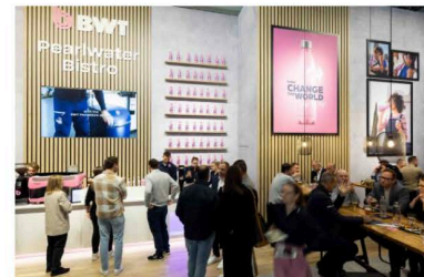
BWT auf der ISH

Ein Highlight des Auftritts bildete die „Street of Innovations“, eine interaktive Erlebniswelt, die die neuesten Innovationen von BWT