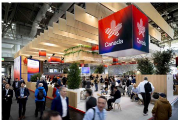
Holtmann+ gestaltete den NGen-Pavillon auf der Hannover Messe 2025