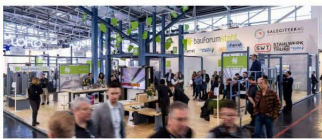
Messestand vom bauforumstahl auf der Bau 2025

Ist nachhaltiger Stahlbau möglich? Diese Frage beantwortete bauforumstahl e.V. bereits auf der BAU 2023 mit einem klaren Ja – und setzte auch 2025 erneut Maßstäbe. Auf der Weltleitmesse für Architektur, Materialien und Systeme zeigte der Verband, wie nachhaltiger Stahlbau in die Praxis transferiert werden kann. Holtmann+ begleitete den Gemeinschaftsstand des Kunden von der ersten Idee über die Konzeption bis hin zur finalen Umsetzung – mit durchdachten, ressourcenschonenden Lösungen, die überzeugen.